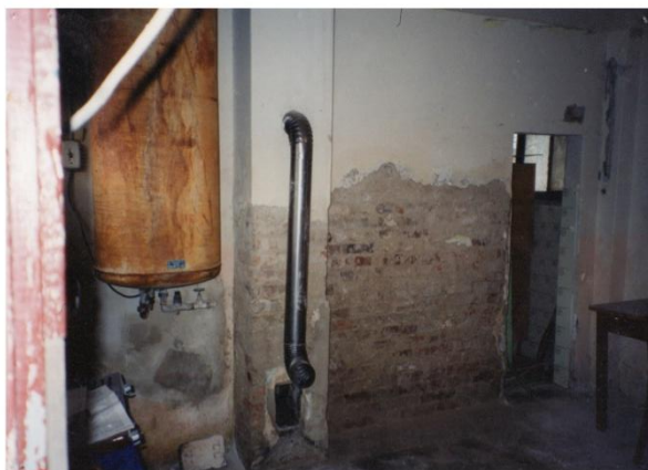
Šatna předaná Sokolům v roce 1995

Informační fotografie – „údržby“ areálu dle oddílů (TJ Bojkovice vers. Sokol):