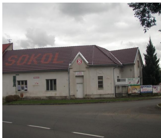
Střecha Sokolovny po opravě, na které členové naší T.J. odpracovali více jak 1000 brigádnických hodin