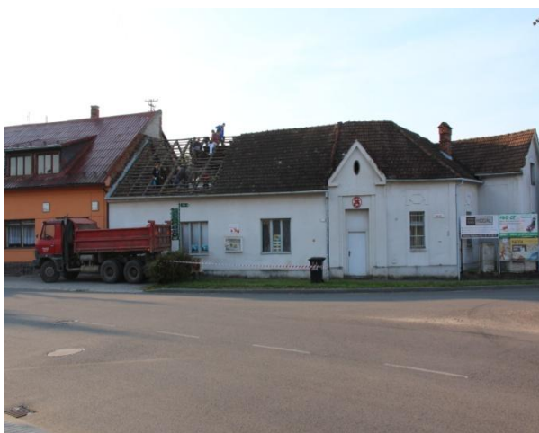
Výměna zchátralé střechy Sokolovny, kterou řadu let pronajímala TJ Bojkovice a peníze neinvestovala zpět do oprav užívaného majetku