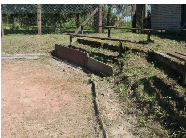
Panem Ogrodníkem vzpomínaná a volejbalisty „udržovaná“ tribuna