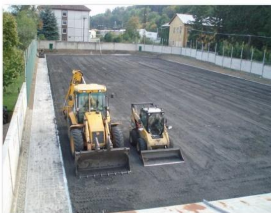
Tenisové a volejbalové kurty před dokončením generální opravy (nový povrch, chodníky, oplocení, závlahy..) – r. 2012