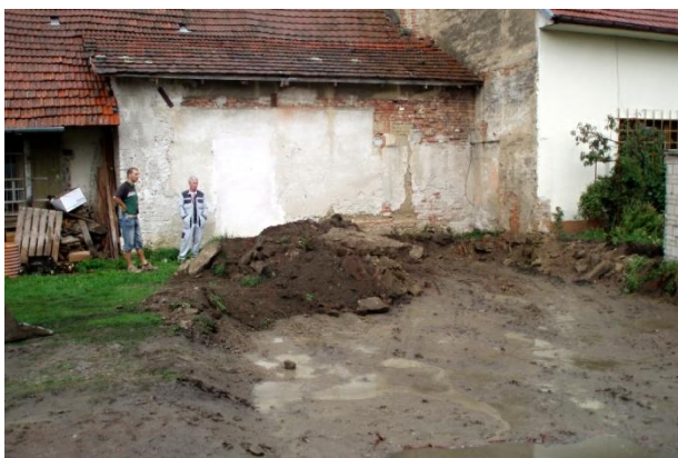
Nádvoří po předání majetku od TJ