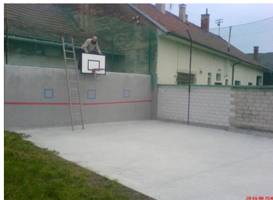
Stejné místo po vybudování tenisové stěny – r. 2008